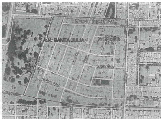
Gráfico N°2: Mapa de ubicación de calles del proyecto

Gráfico N°1: Mapa de ubicación del distrito de Veintiséis de Octubre en la Región PIURA