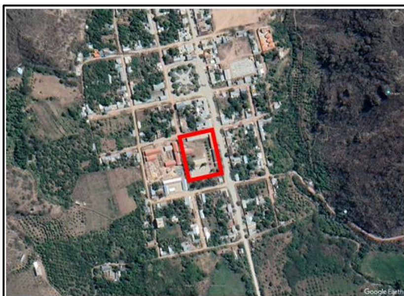
Ilustración 1- Ubicación del terreno

Región : La Libertad Provincia : Bolívar Distrito : Longotea Centro Poblado : San Vicente de Paul Dirección : Avenida Fernando Belaunde Terry