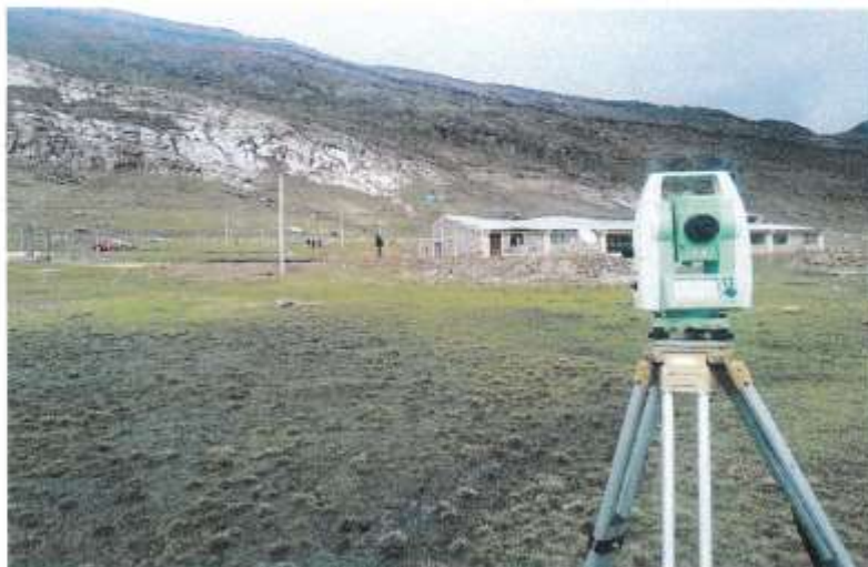
Imagen 1: Micro Localización del proyecto