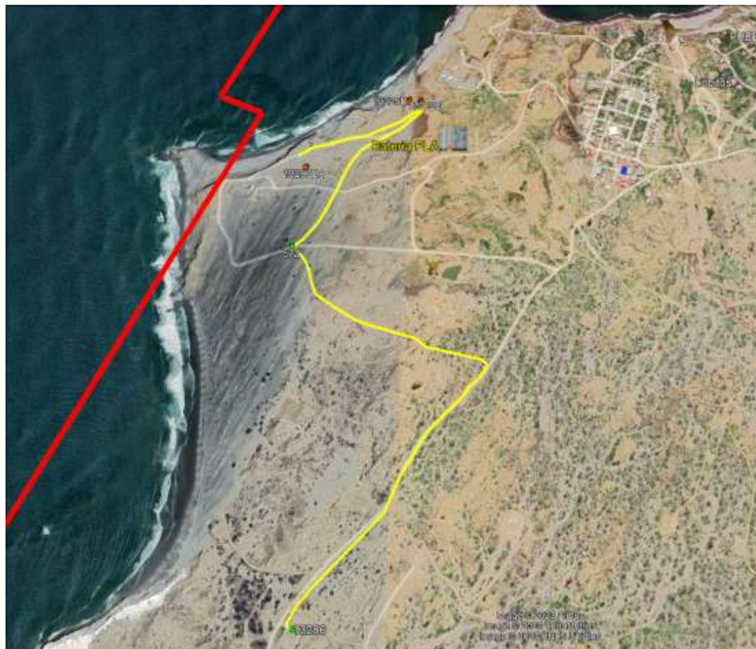
Tabla 1. Pozos Gas Lift – Pozos inyectoros