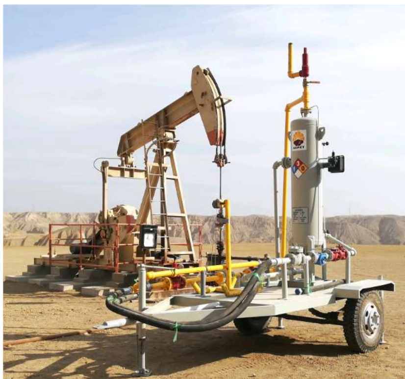
Figura 2. Equipo de Medición Portátil

Adicionalmente se requiere realizar trabajos de medición en pozos PU, Recoil, Gas Lift, PUP para el monitoreo y optimización de producción.