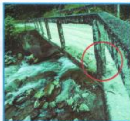
PUENTE LA PALMA