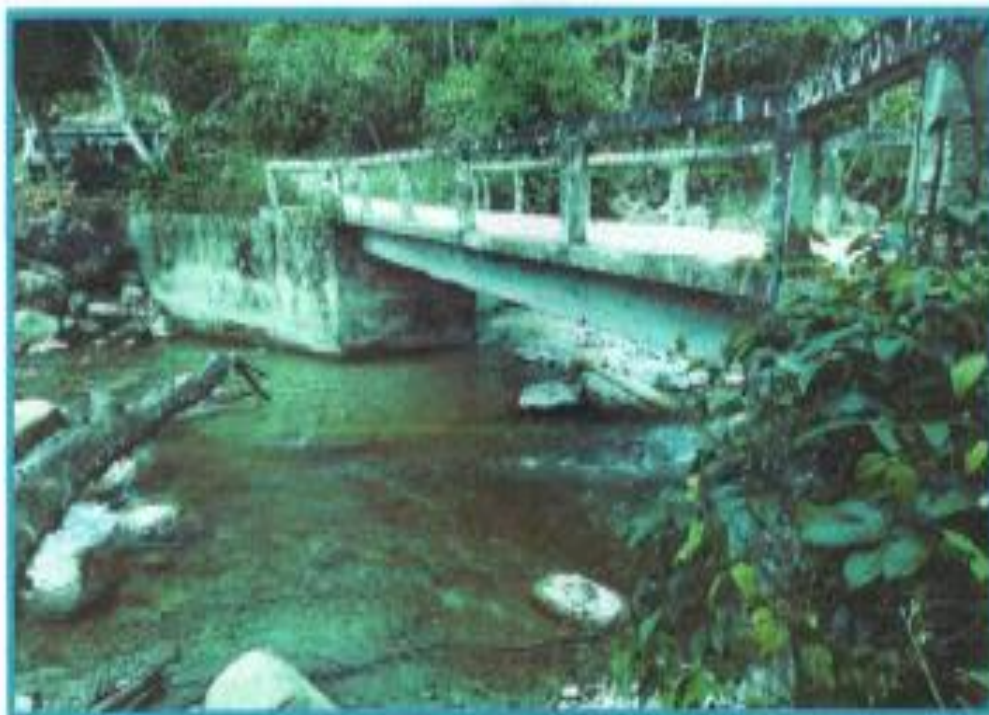
Ilustración 7 Estado actual del puente LA PALMA