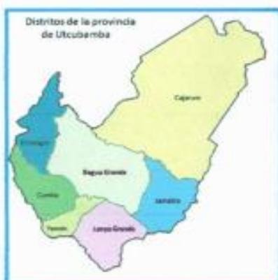
DISTRITO DE JAMALCA