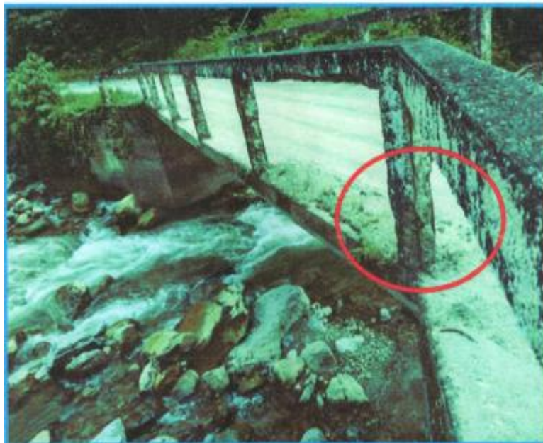
Ilustración 6 Se aprecia que el puente requiere con urgencia la colocación de muros de contención debido que en los lados están expuestos hacia el río, sin protección pudiendo ocasionar accidente.

Se aprecia en la inspección que las barandas de concreto están totalmente desgastadas, notándose el acero.