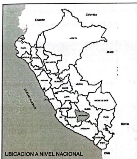
UBICACION A NIVEL NACIONAL

Este : 671480.18 m E Norte : 8490394.47 m S Latitud : 13°39'23"S Longitud : 73°25'29"O Región natural : Sierra