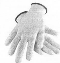
Guantes de Seguridad de Obra