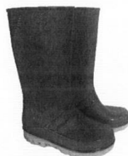
Botas de Jebe