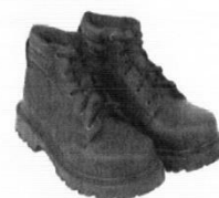
Zapatos de Seguridad con Puntera de Acero