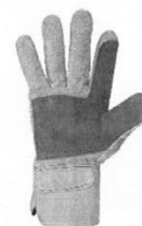
Guantes de Seguridad de Obra