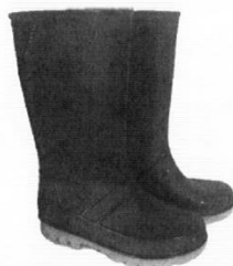
Botas de Jebe