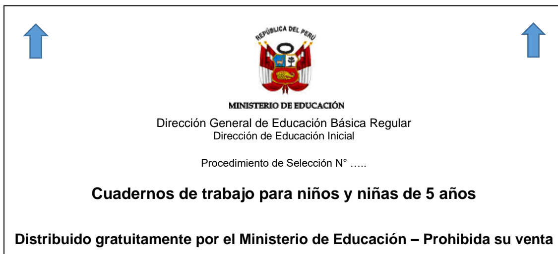
Imagen modelo 2