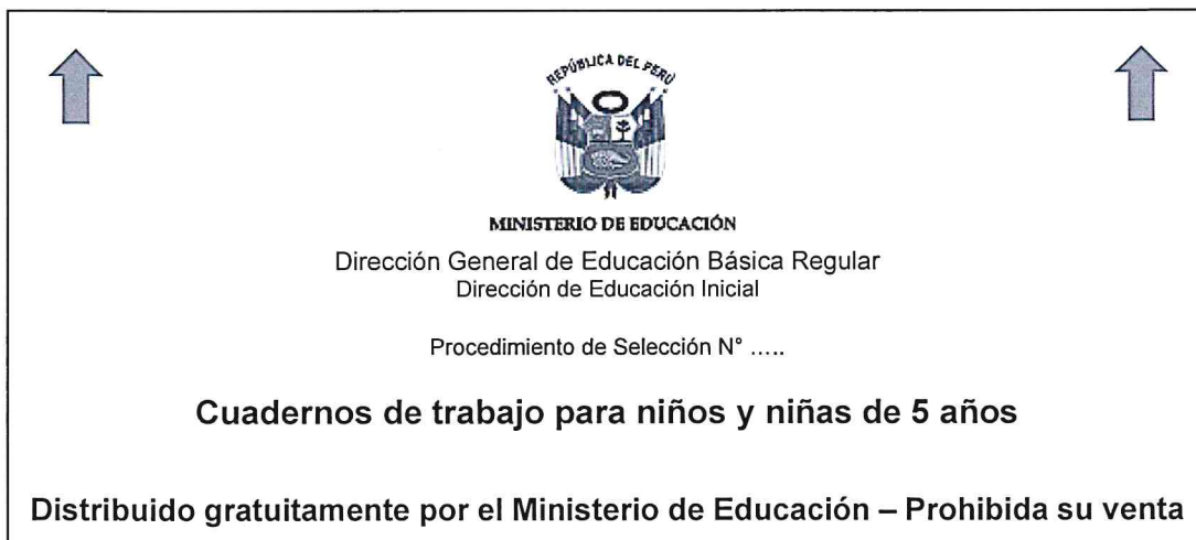
Imagen modelo 2