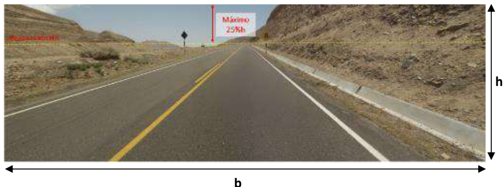
Visualización aceptada (con vista de plataforma)

Términos de Referencia del Servicio de Gestión y Conservación Vial por Niveles de Servicio del Corredor Vial: "Chachapoyas - Molinopampa – Mariscal Benavides - Rodríguez de Mendoza – Abra Lajas / El Dorado- Selva Alegre- Soritor-Emp. PE-5N (Calzada)"