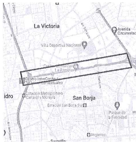
Figura 1: Coordenadas: 277289.85 m E; 8668577.94 m S; Z 18L