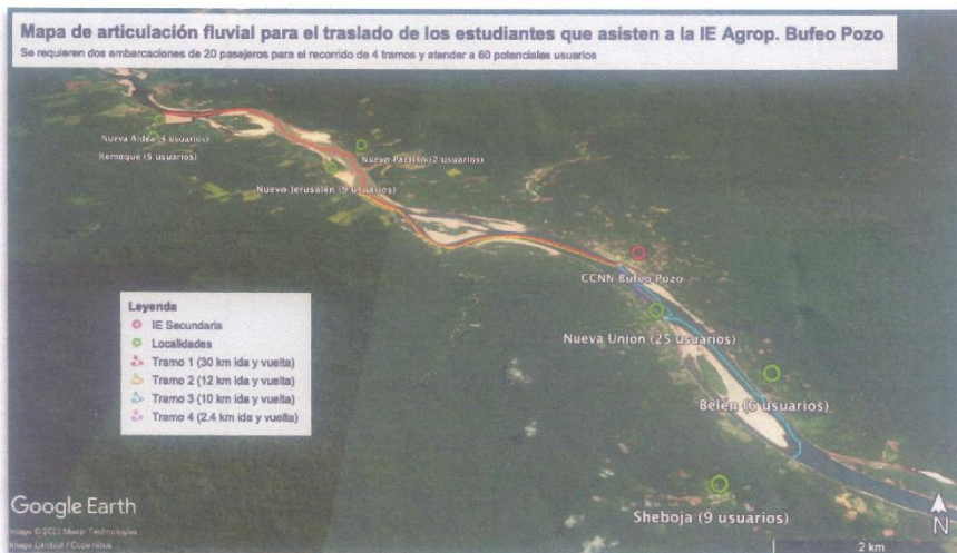
Diagrama del desplazamiento en la RER Sepahua 4