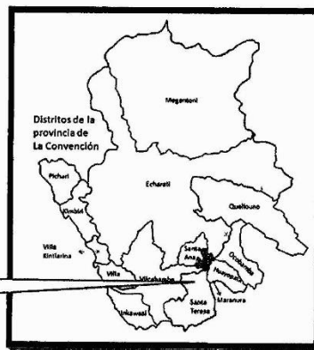
IMAGEN N° 01: LOCALIZACIÓN GEOGRÁFICA PROVINCIA: LA CONVENCION