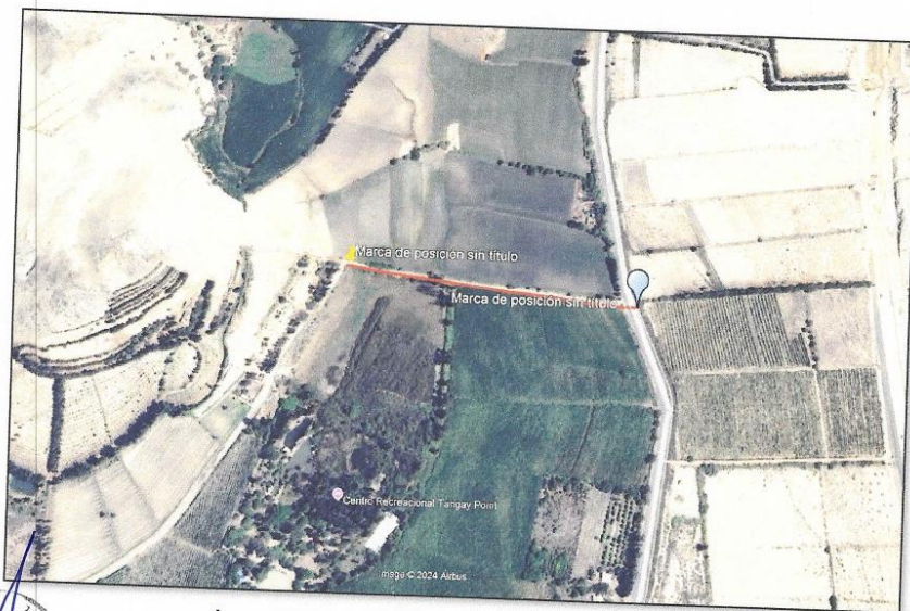
Imagen N°02: Imagen Satelital de la Localización del Canal 24B