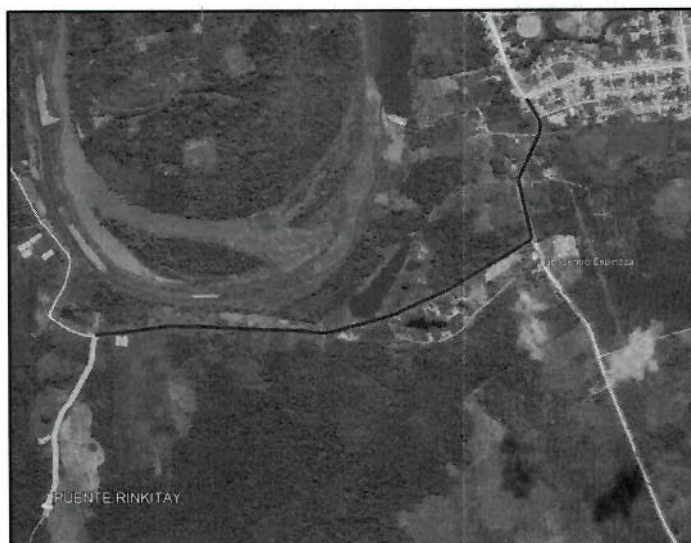
Distrito Nueva Requena – Acceso Rinkitay