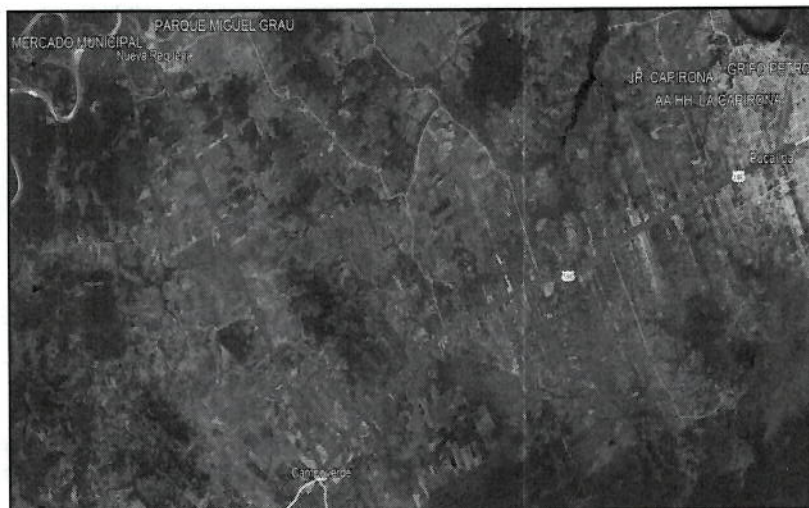
Pucallpa – Distrito de Nueva Requena