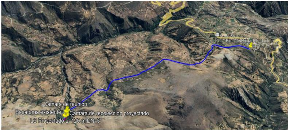
Imagen 3: Imagen satelital de la ubicación del proyecto – Agua Potable.

El proyecto se encuentra ubicado aproximadamente a 146.2 km tomando como referencia a la ciudad de Ayacucho. La infraestructura vial intercomunal es precaria y en su mayoría es inexistente a nivel interdistrital e interprovincial. El acceso a la zona del proyecto desde la ciudad de Ayacucho (capital de región Ayacucho) es como sigue: