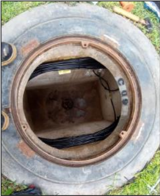
Tipo de identificación de cámara de comunicaciones