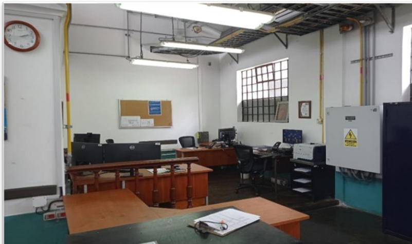
Figura 1. Área administrativa actual en la CNM.