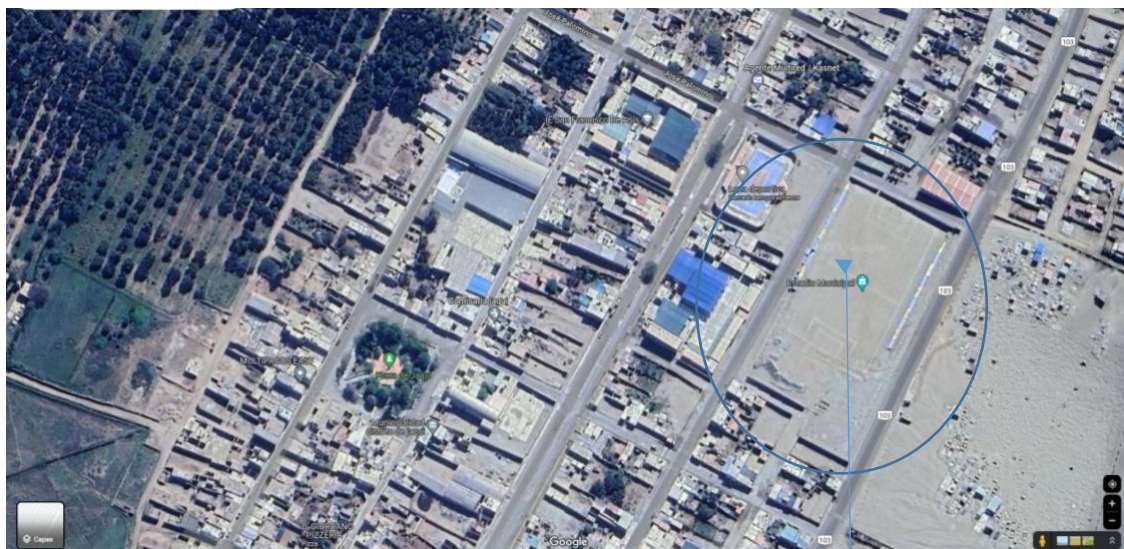
Ubicación del Terreno