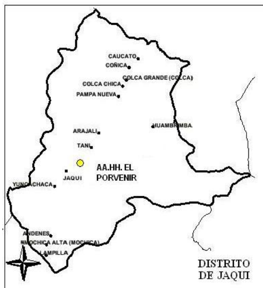
CENTROS POBLADOS DE JAQUI