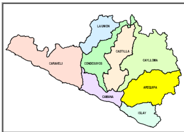
PROVINCIAS DE AREQUIPA

Jaqui se encuentra ubicado a una altitud de 295 m.s.n.m.