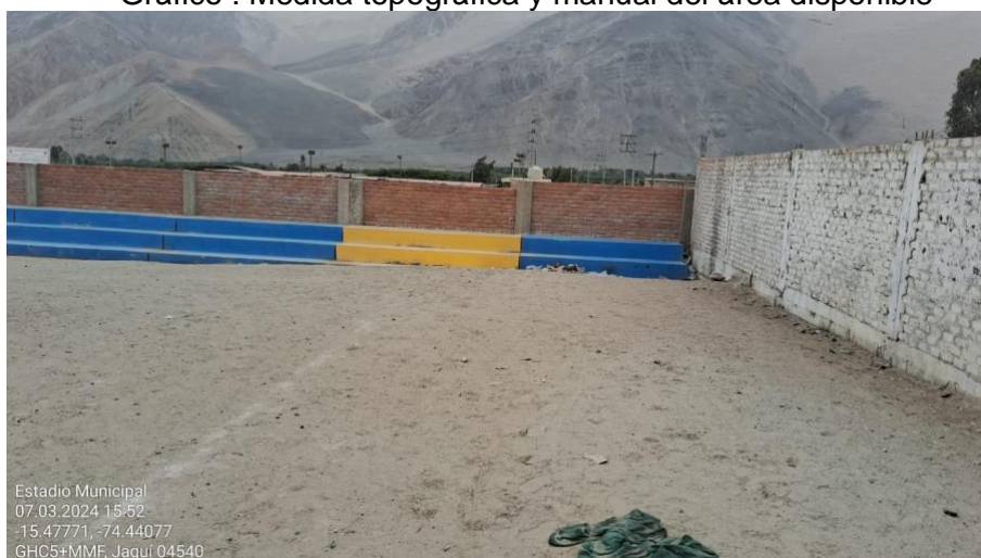
Gráfico : Medida topográfica y manual del área disponible

En consecuencia, el área en cuestión (Estadio de Jaqui), no tiene un servicio adecuado a los pobladores de la zona, teniendo la necesidad de hacer las reparaciones y construcciones pertinentes para un uso adecuado y en bien de la sociedad.