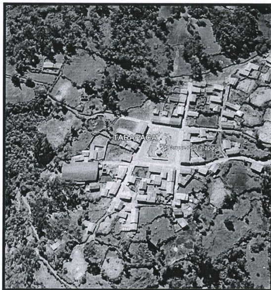
Lugar del proyecto.