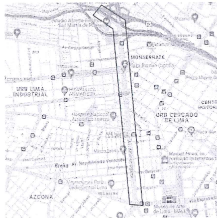
Figura 03. Ubicación – Distrito de San Martín de Porres y Av. Alfonso Ugarte.