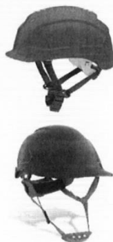
Casco de Seguridad