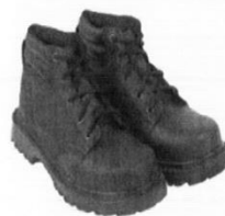
Zapatos de Seguridad con Puntera de Acero