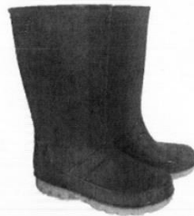
Botas de Jebe