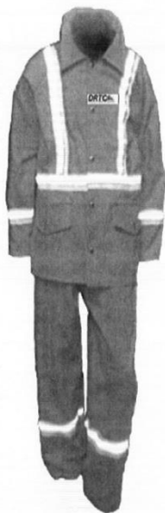
Uniforme de Mantenimiento