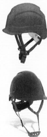
Casco de Seguridad