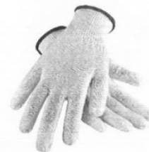
Guantes de Seguridad de Obra