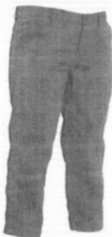
Uniforme de Mantenimiento