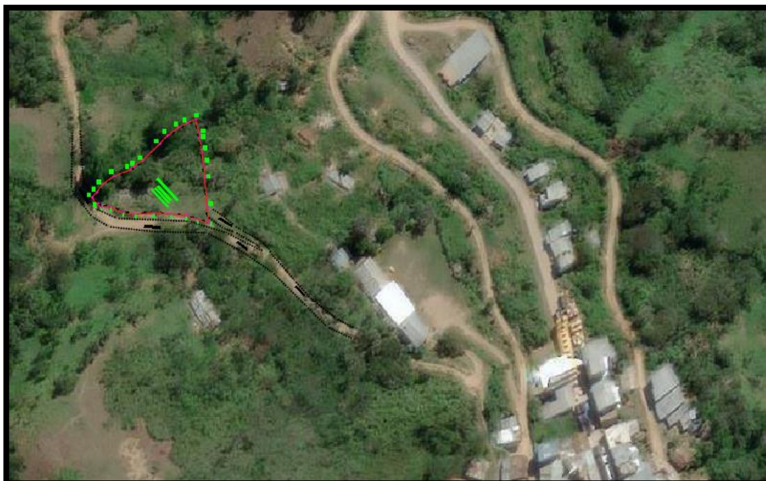
GRÁFICO 05: Ubicación del Proyecto

Los presentes requerimientos técnicos mínimos tienen como objeto señalar y establecer las condiciones mínimas bajo las cuales el CONTRATISTA ejecutará las prestaciones con el fin de cumplir las metas previstas en el Proyecto de Inversión Pública denominado: "MEJORAMIENTO DEL SERVICIO EDUCATIVO DEL NIVEL INICIAL DE LA I.E.304, DISTRITO DE CALLAYUC DE LA PROVINCIA DE CUTERVO DEL DEPARTAMENTO DE CAJAMARCA" C.U.I. N.º 2587833