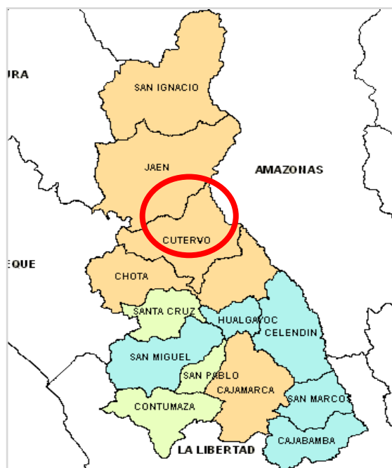
Gráfico 02: Ubicación de la Provincia de Cutervo – Cajamarca