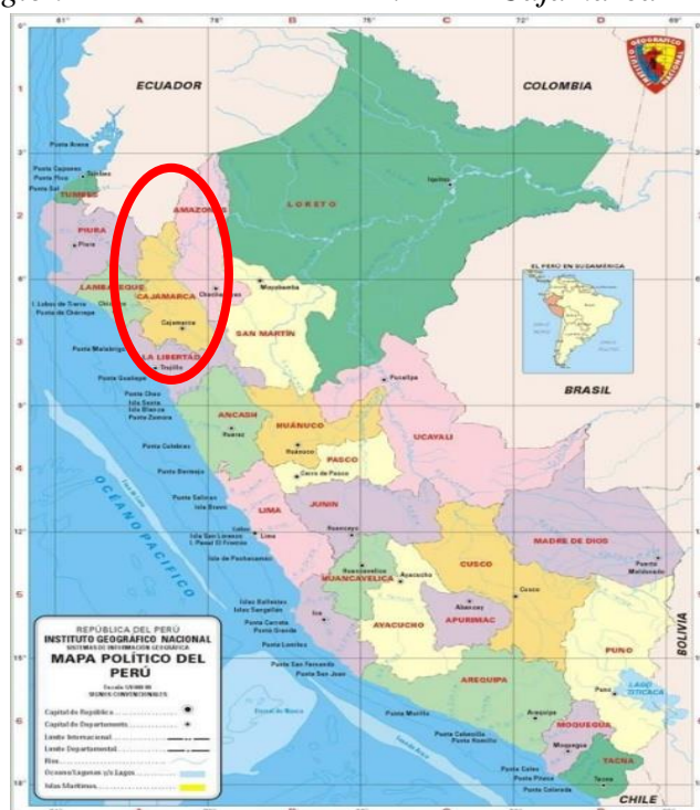
Gráfico 01: Ubicación del Departamento de Cajamarca

Localidad : Callayuc Distrito : Callayuc Provincia : Cutervo Región : Cajamarca