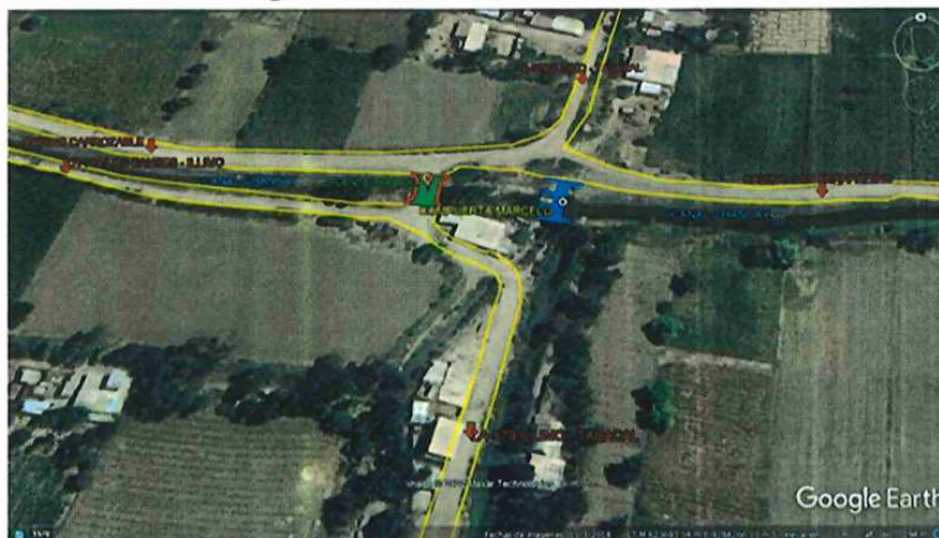
Imagen N°02: Ubicación del Puente Tabacal.

"Año del Bicentenario, de la consolidación de nuestra Independencia, y de la conmemoración de las heroicas batallas de Junín y Ayacucho".