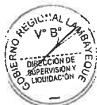
FORMATO N° 01 Cédula de Notificación por Medios Electrónicos (Correo Electrónico)