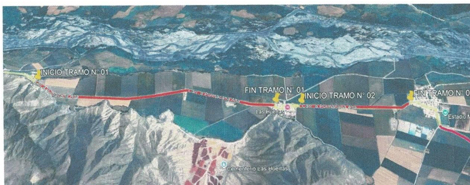
IMAGEN 1. UBICACIÓN DE LA ZONA DE INTERVENCIÓN