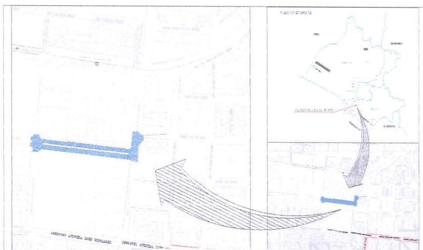
IMAGEN N° 02: Ubicación del área de intervención en la Av. Grau.