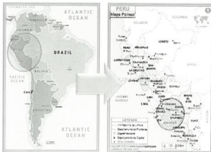
FIGURA N° 01 - MAPA DE UBICACIÓN MACRO