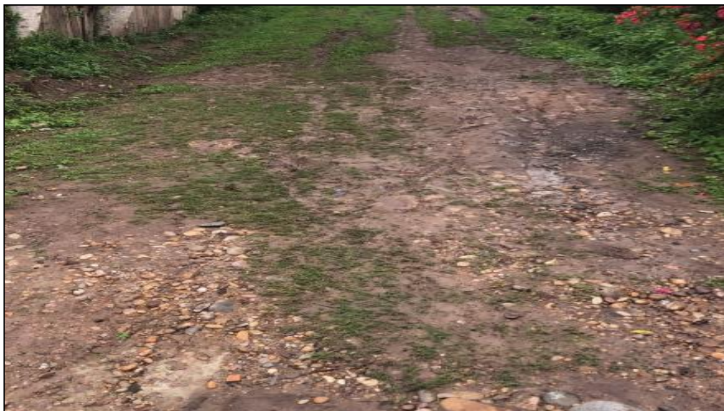
Jr. Huaynacapac C-02.

Las veredas existentes han sido construidas de manera artesanal por los propietarios de los predios, tal como se puede observar en la presente imagen.