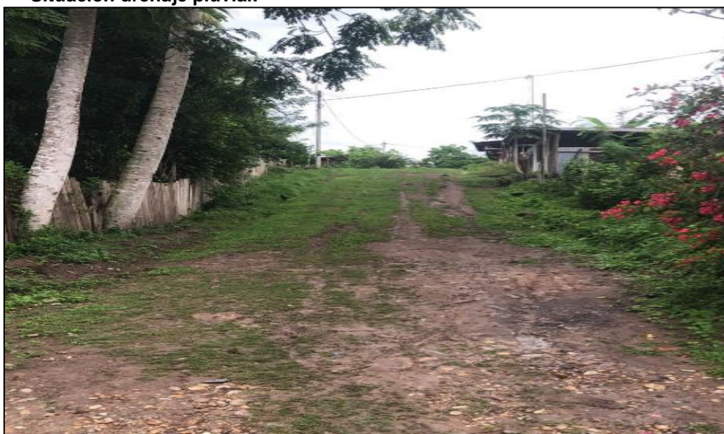
Jr. Huaynacapac C-02.

Las veredas existentes han sido construidas de manera artesanal por los propietarios de los predios, tal como se puede observar en la presente imagen.