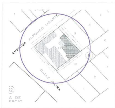
Ilustración 2 Plano de localización de la IPRESS