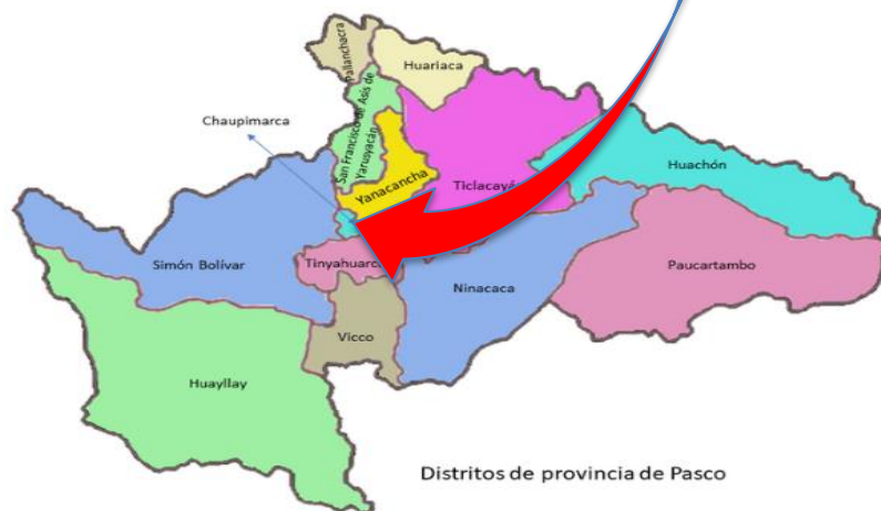
Distritos de provincia de Pasco