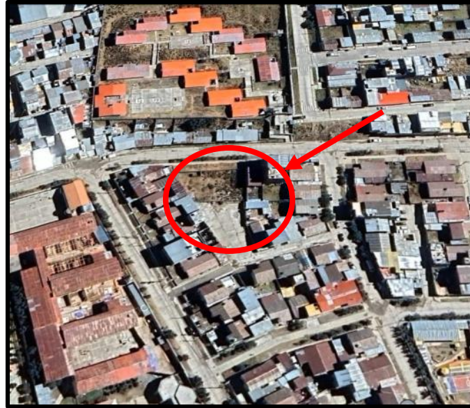
Vista panorámica de la ubicación del EESS Virgen del Carmen