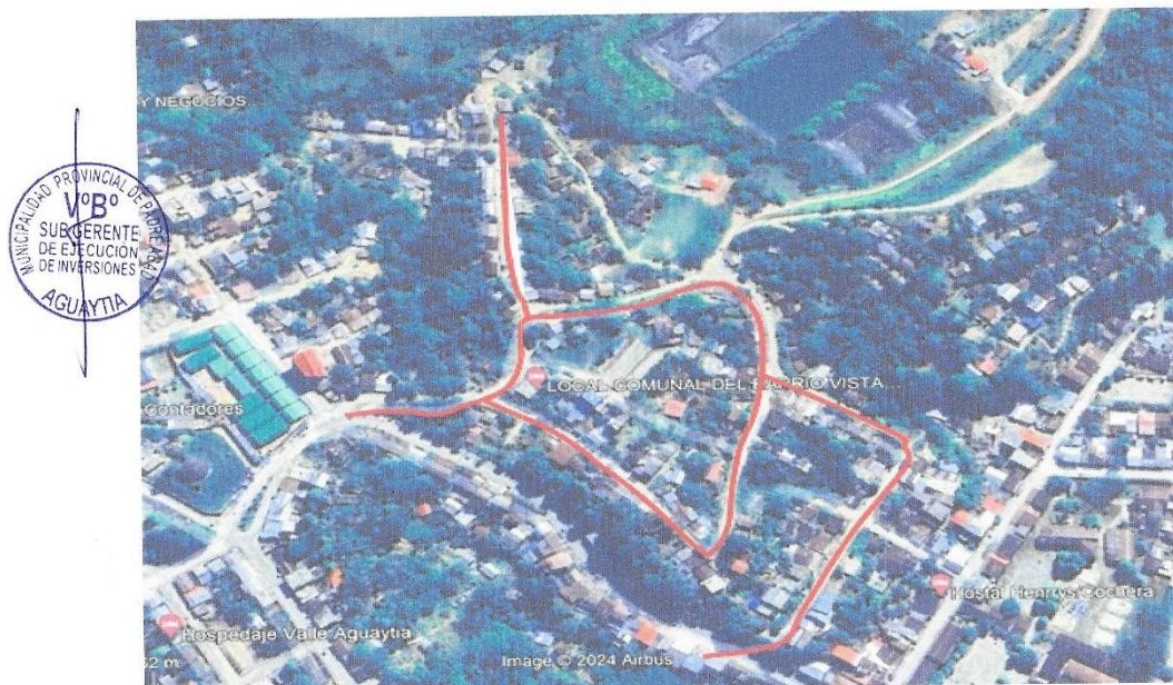
VISTA SATELITAL DE LA ZONA DE INTERVENCIÓN DEL PROYECTO

Estructuralmente el proyecto consiste en el mejoramiento de la superficie de rodadura del JR. SUCRE CDRA 1,2, JR. FRANCISCO BOLOGNESI CDRA. 1, 2,3, JR. SAN MARTIN CDRA 1, JR. 7 DE JUNIO CDRA 1, JR. SAN COSME CDRA 2,3, CALLES 16,17 Y PASAJES DE LA JUNTA VECINAL CERRO SAN COSME. Construido a base de un Pavimento rígido de concreto de resistencia f_c=210 \text{ kg/cm}^2 , espesor 20cm, colocados sobre una base granular de 20cm, con relleno de material de préstamo e instalación de Geo sintéticos (Geo mallas y Geotextiles). Entre la base granular y el relleno con material propio o el relleno con material de préstamo se colocará un geo textil no tejido anticontaminante para evitar la infiltración de los finos en la base granular. Como también se colocará el Geotextil entre el material de relleno y material contaminado