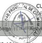
CUADRO N° 02: PRIORIZACIÓN DE ACTIVIDADES DE MANTENIMIENTO RUTINARIO SEGÚN EL ESTADO DEL TIEMPO

De acuerdo a lo anterior se distribuye las actividades a ser desarrolladas durante el año en el siguiente cuadro indica las prioridades establecidas.