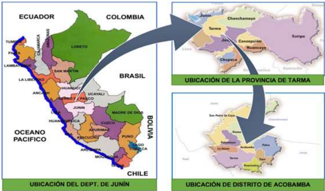
FIGURA 01: Ubicación Política del proyecto

Zona : 18L Este : 425639.00 m E Norte : 8748006.00 m S Altitud : 29235 msnm