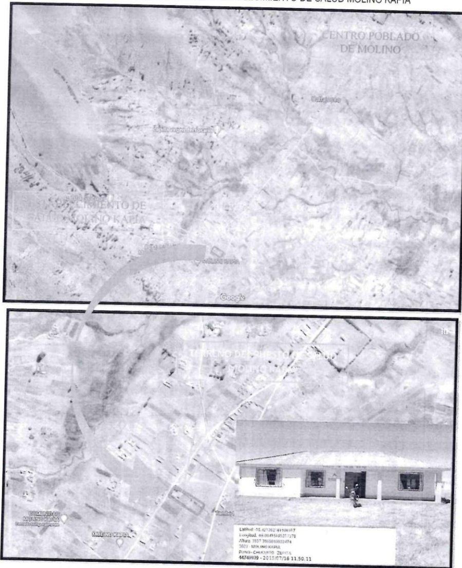
FIGURA N° 01 UBICACIÓN ACTUAL DEL ESTABLECIMIENTO DE SALUD MOLINO KAPIA