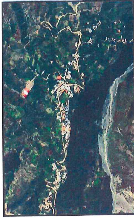
IMAGEN N°01: UBICACIÓN DEL PROYECTO

Geográficamente la zona del proyecto se ubica dentro de las coordenadas UTM - WGS 84: NORTE: 8975017.20m ESTE: 204130.34m. Localización del Proyecto en el mapa del país y en el mapa vial departamental.