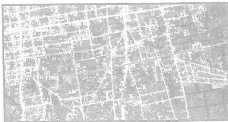
Figura 01. Vías a intervenir Jr. Alfonso Ugarte del distrito de Huancan

Distrito : MUNICIPALIDAD DISTRITAL DE HUANCAN Provincia : Huancayo Región : Junín