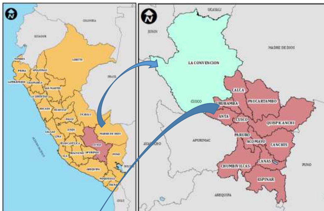
Figura N° 01 Ubicación política del Proyecto