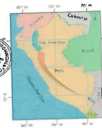
Ubicación de la Provincia de Luya

"CAPITAL ARQUEOLÓGICA DEL NOR ORIENTE PERUANO"