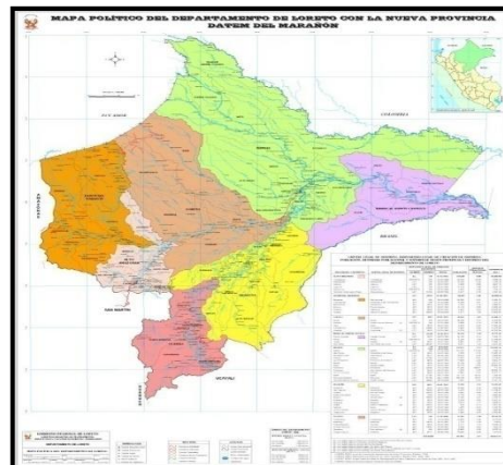
DEPARTAMENTO DE LORETO