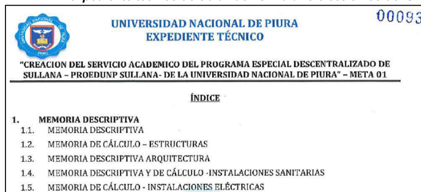
Imagen N° 3: Extracto del Índice publicados en la sección 2, apartado “Índice del expediente técnico de obra” del formulario electrónico del SEACE.