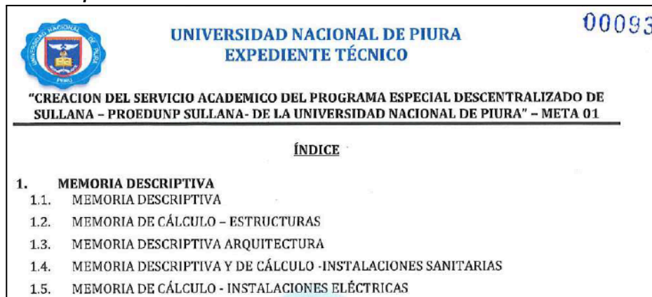
Imagen N° 5: Extracto del Índice publicados en la sección 2, apartado “Índice del expediente técnico de obra” del formulario electrónico del SEACE.