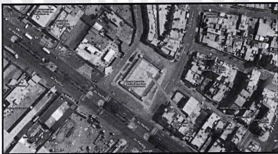
Micro Localización (Distrito Nuevo Chimbote – COMPLEJO DEPORTIVO MARISCAL LUZURIAGA)