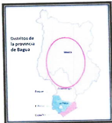
LOCALIZACIÓN GEOGRÁFICA DEL DISTRITO DE IMAZA