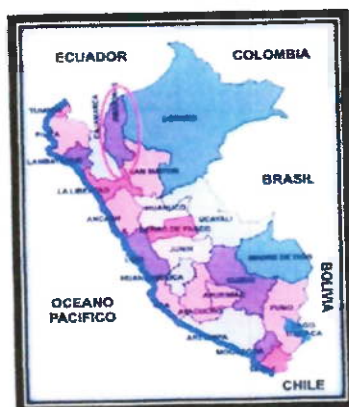
LOCALIZACIÓN GEOGRÁFICA DEL DEPARTAMENTO DE AMAZONAS

Esquema de Macro Localización del IOARR de la localidad beneficiaria.