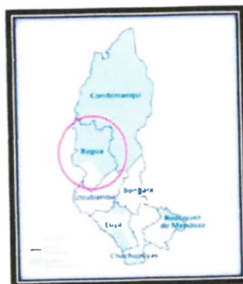
LOCALIZACIÓN GEOGRÁFICA DE LA PROVINCIA DE BAGUA