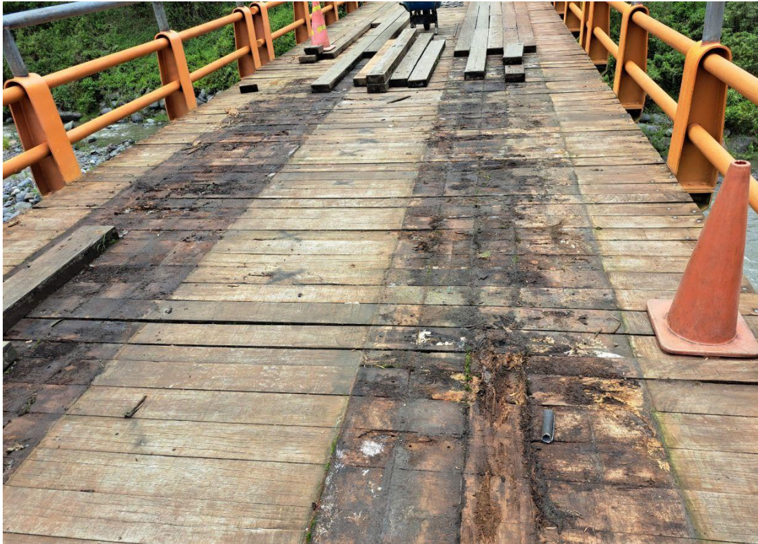
Fotografía N° 3. Se observa que la madera transversal ha perdido todas las propiedades