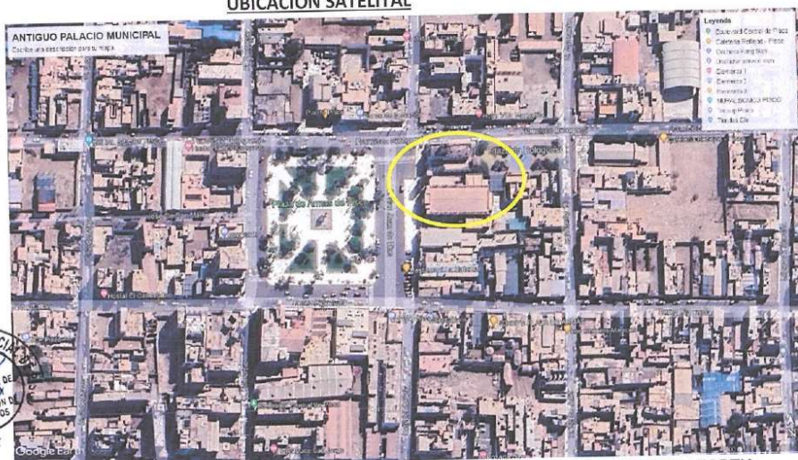
ANTIGUO PALACIO MUNICIPAL DE LA PROVINCIA DE PISCO