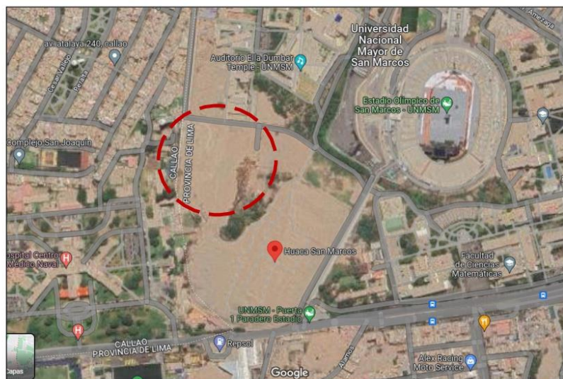
Ilustración 1: Vista Satelital del Terreno a intervenir

El proyecto se localiza en zona de expansión, El predio corresponde a un terreno de forma irregular, de topografía ligeramente plana, con acceso a la ciudad universitaria por la puerta N° 1 (entrada al estadio en Av. Venezuela), entrando camino hacia el terreno denominado La Huáca.