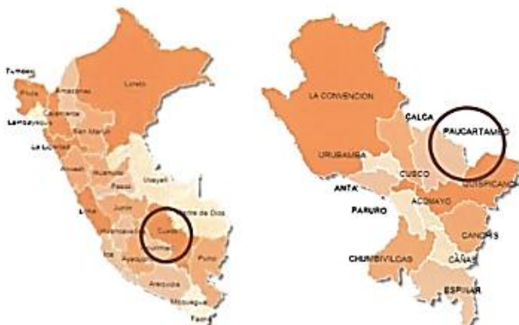
MAPA N° 01: MACRO LOCALIZACIÓN Y MICRO LOCALIZACIÓN