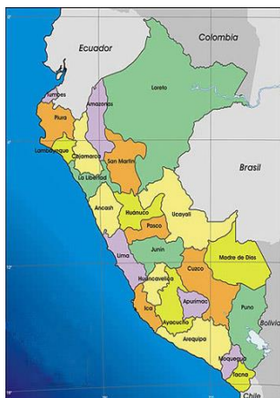
Mapa de macro localización del Perú