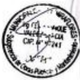
Calle Costa Rica