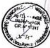
Calle Costa Rica