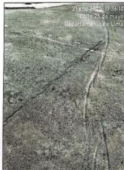
Imagen N°02 Y N°03 – Estado actual de la calle 25 de mayo