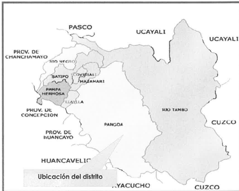
MAPA DE LA PROVINCIA DE SATIPO