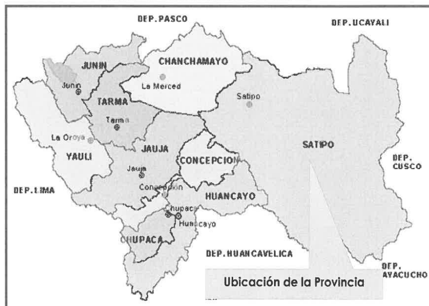
MAPA DEL DEPARTAMENTO DE JUNIN

MUNICIPALIDAD DISTRITAL DE PANGOA COMITÉ DE SELECCIÓN