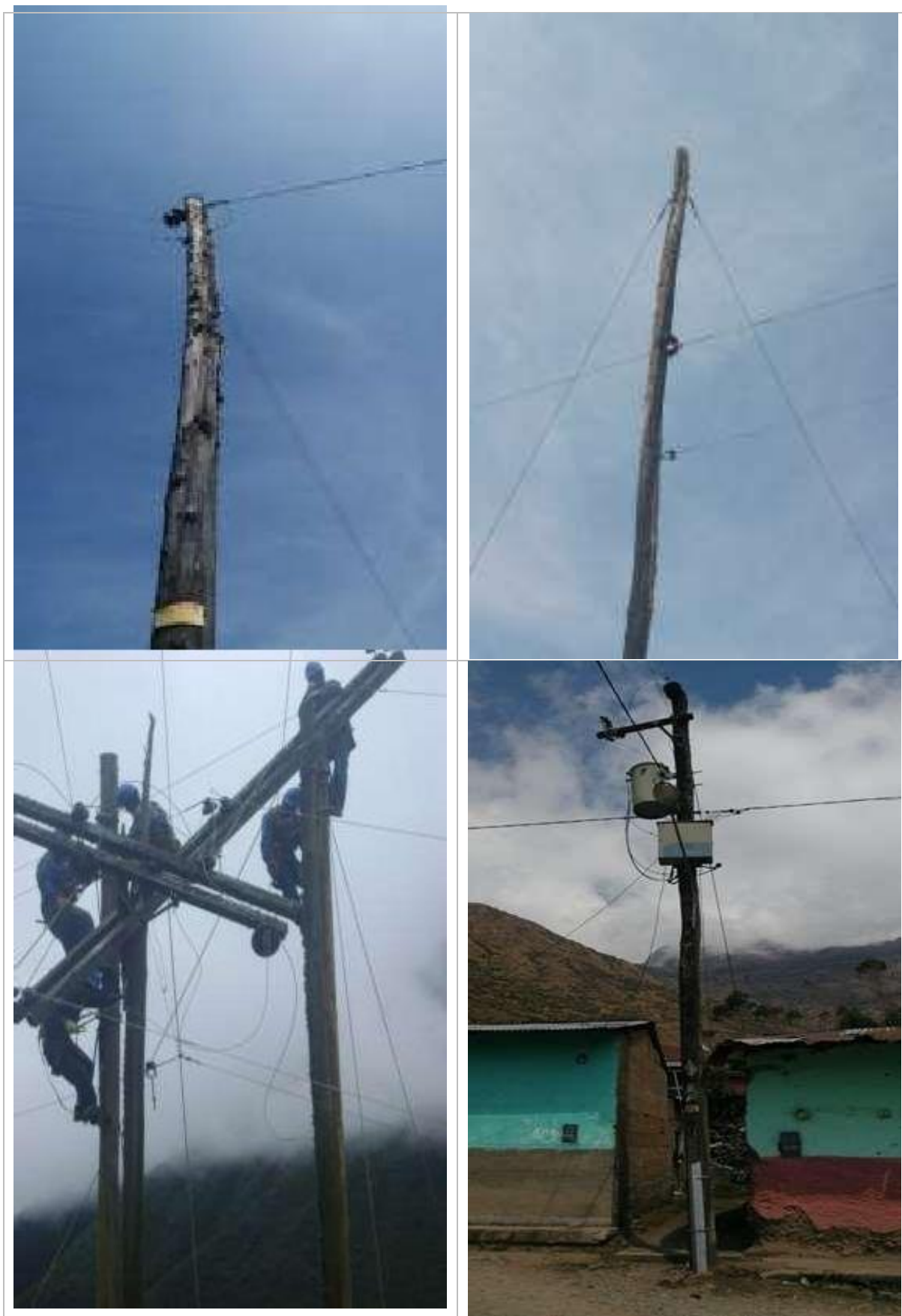
Figura N° 8: Fotografías del diagnóstico preliminar - Alimentador A4507