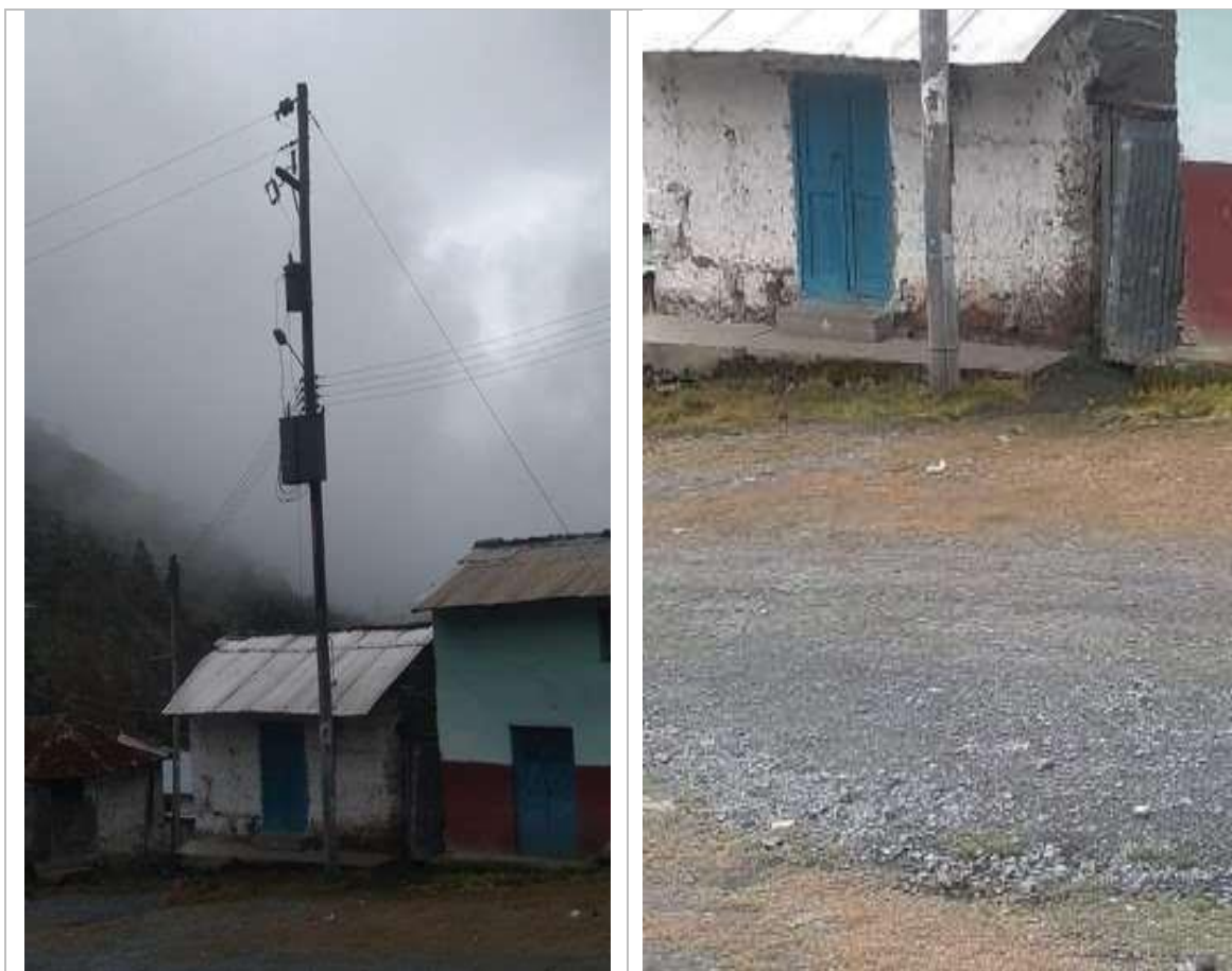
Estructuras en el AMT A4509, requieren su mejoramiento, por cumplir vida útil o incumplimiento de DMS

Los alcances no son limitativos, si durante el diagnóstico de la unidad productora, El Consultor identifica mayores deficiencias, deberá incluirlas en la alternativa de solución que plantee; sin perjuicio a lo indicado, en el estudio se debe considerar aproximadamente lo siguiente para los proyectos que involucran los alimentadores: