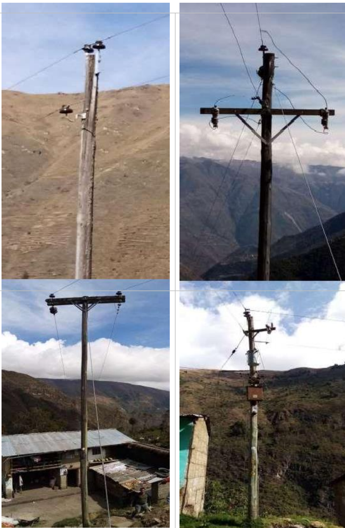
Estructuras en el AMT A4508, requieren su mejoramiento, por cumplir vida útil o incumplimiento de DMS