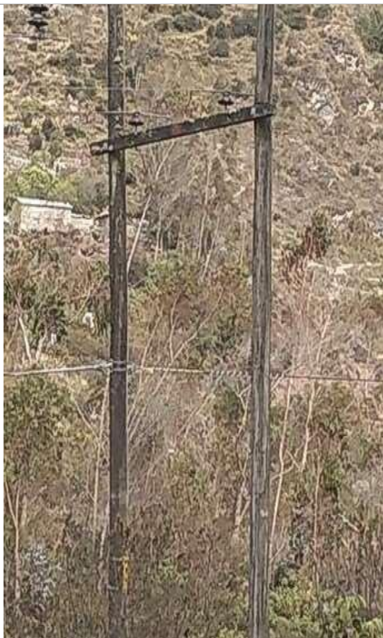
Estructuras en el AMT A4506, requieren su mejoramiento, por haber cumplido su vida útil o incumplimiento de DMS