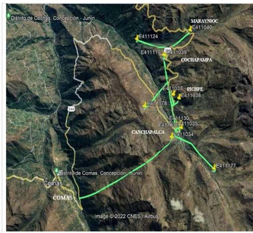
Figura N° 5: Ubicación de las localidades del Proyecto – AMT 4509