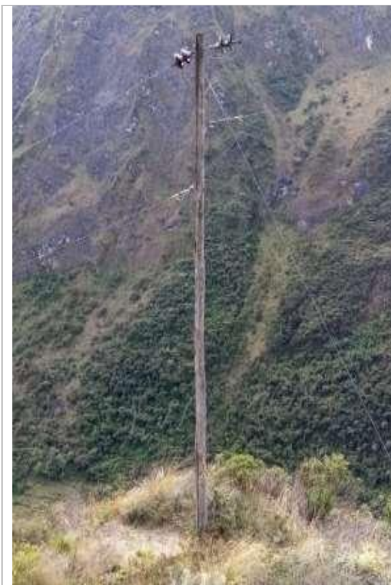
Figura N° 9: Fotografías del diagnóstico preliminar - Alimentador A4508