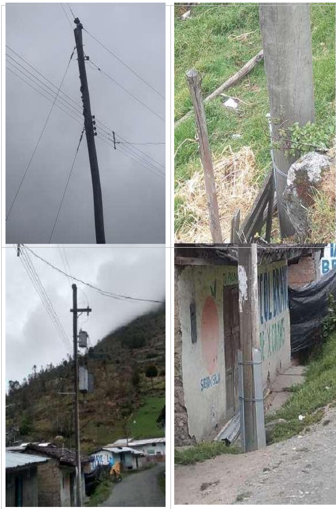
Figura N° 10: Fotografías del diagnóstico preliminar - Alimentador A4509