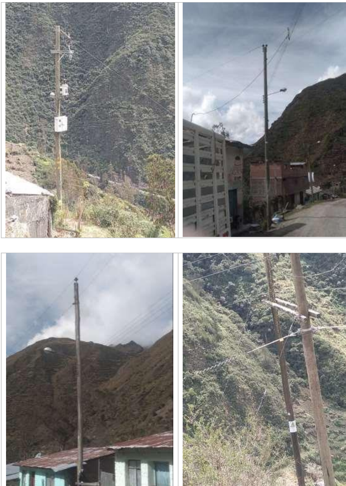
Figura N° 7: Fotografías del diagnóstico preliminar - Alimentador A4506

A continuación, se muestran algunas imágenes del estado situacional por alimentadores: