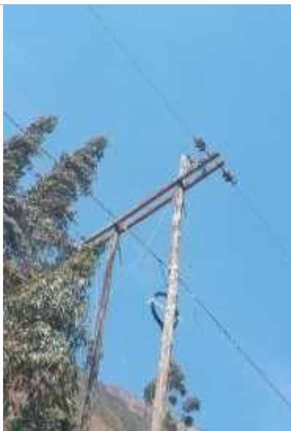
Estructuras en el AMT A4507, requieren su mejoramiento, por cumplir su vida útil o incumplimiento DMS